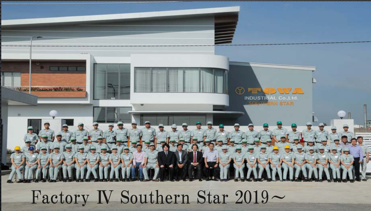
Factory IV Southern Star 2019～